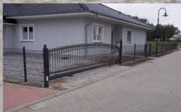
Schiebetor - Modell 240 und Doppelstabmattenzaun in anthrazit RAL 7016