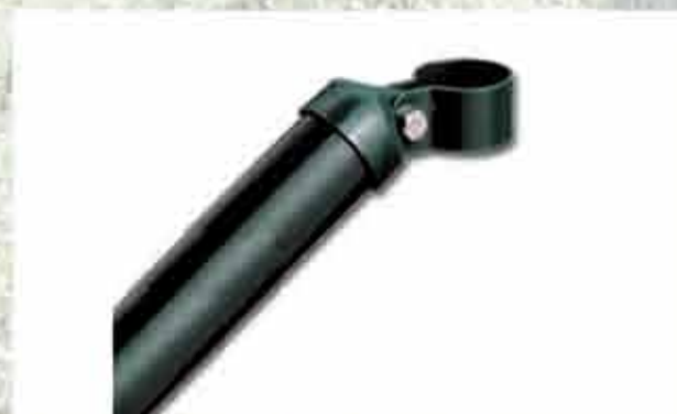
Streben inkl. Strebenkappe und Schelle