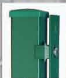
Pfosten mit Flacheisenabdeckung