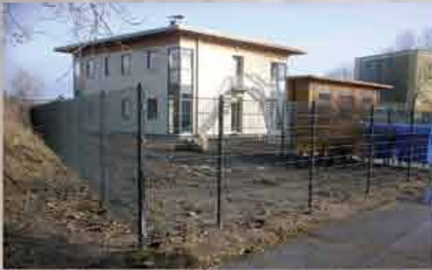
Doppelstabmattenzaun 1,83 m, anthrazit pulverbesch.