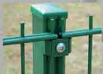
Pfosten mit Klemmhalter

Pfosten aus Vierkantröhr 40 x 60 mm mit Kunststoffkappe, erhältlich in zwei Ausführungen