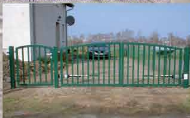
Pforte und Doppeltor - Modell 190 gebogen; Füllung mit Rechteckstäben in moosgrün RAL 6005