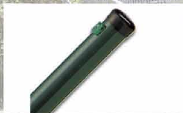
Pfosten inkl. Pfostenkappe und Spanndrahthalter

Oberfläche verzinkt und pulverbeschichtet in moosgrün RAL 6005