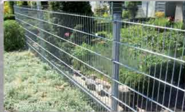
Doppelstabmattenzaun 1,03 m, verzinkt

Der Doppelstabmattenzaun zeichnet sich durch sein zeitloses Design, Stabilität und ein gutes Preis-/ Leistungsverhältnis aus.