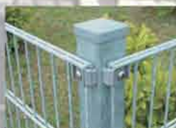
Eckpfosten mit Klemmhalter