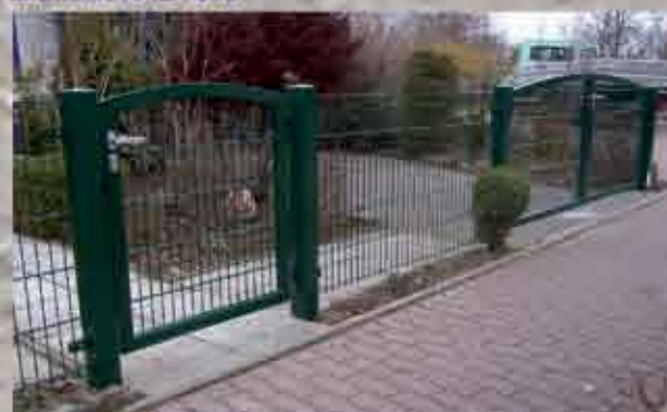
Pforte und Doppeltor - gebogen, Füllung mit Doppelstabmatte und Zaun in moosgrün RAL 6005