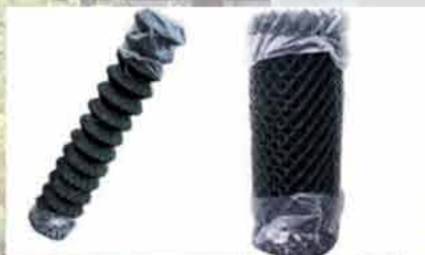
Baumkuchenwicklung (BKW) und Normalwicklung (NW)

hadra ® 4-eck - Geflecht Oberfläche verzinkt und moosgrün ummantelt in RAL 6005