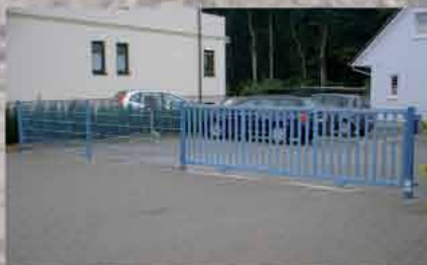
Schiebetor - Modell 190; Füllung mit Rechteckstäben und Doppelstabmattenzaun in fernblau RAL 5023