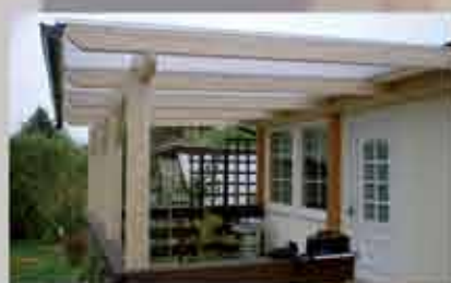
Terrassendach 500 x 300 cm, Pfosten auf vorhandene Brüstung aufgesetzt