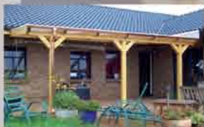
Terrassendach 620 x 300 cm, mit Kupferrinne und Fallrohr