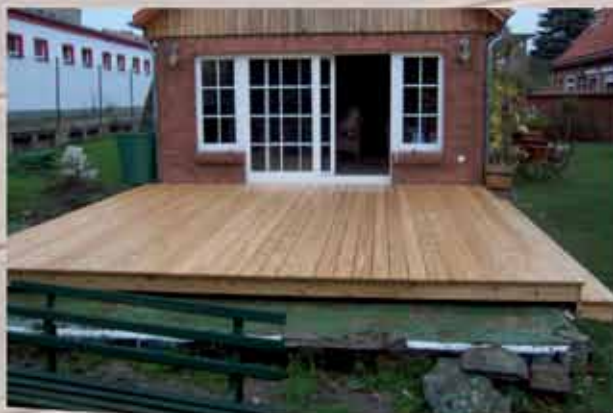
Terrassenboden aus Garapa