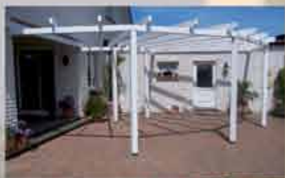
Sternenpergola 500 x 500 cm in weiß