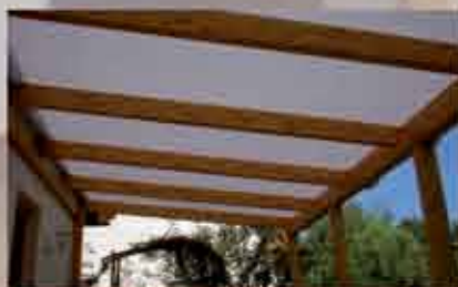
Dacheindeckung mit Stegdreifachplatten in opal