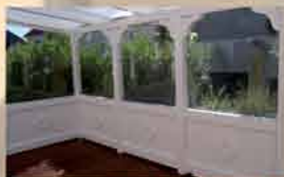
Terrassendach in weiß mit aufwendig verzierten Kopfbändern, Seitenwänden aus Holz und Sicherheitsglas; Terrassenboden aus Bangkirai