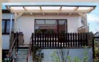
Terrassendach 540 x 300 cm, für vorhandene Hochterrasse gefertigt