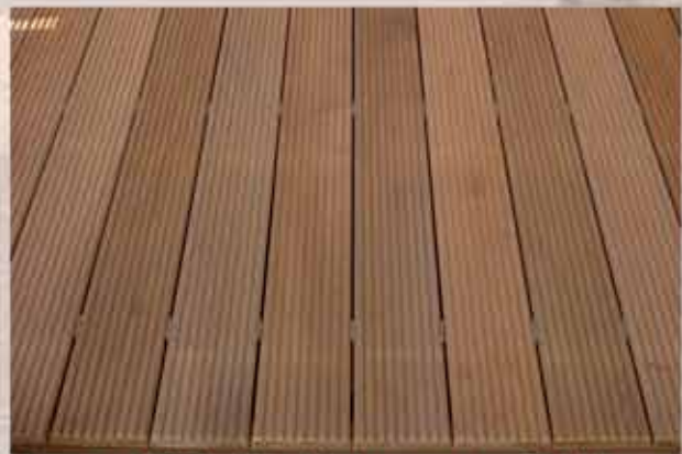
Garapa-Riffelbohlen; Verlegung mit „IGEL“