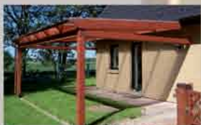
Terrassendach 620 x 400 cm, bauseits behandelt im Farbton Mahagoni