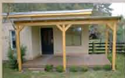
Terrassendach 400 x 250 cm, Dacheindeckung mit Holz / Pappe / Schweißbahn