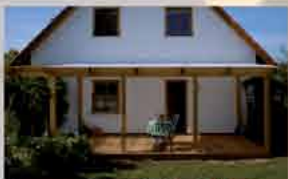
Terrassendach 750 x 400 cm; Holzterrasse aus Garapa