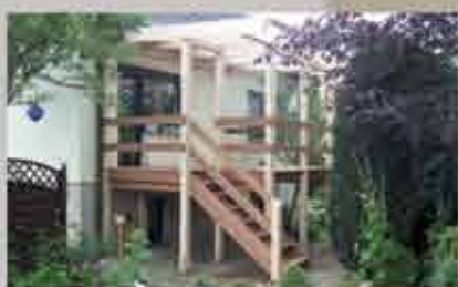
Hochterrasse, Boden aus Bangkirai; Terrassendach 420 x 330 cm