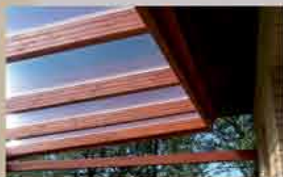
Dacheindeckung mit klaren Stegdreifachplatten