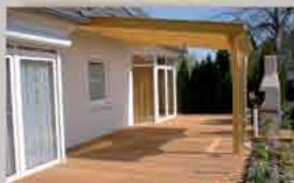
Terrassendach 400 x 350 cm; Terrassenboden aus Bangkirai 1300 x 350 cm