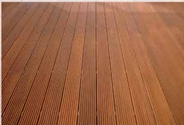
Bangkirai-Riffelbohlen; Verlegung mit „IGEL“

Durch die Fußplatte des Befestigungsigels entsteht ein Abstand zwischen Unterkonstruktion und Belag, somit entsteht keine Staunasse.