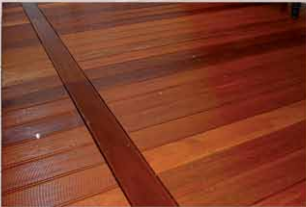
Bangkirai-Riffelbohlen, lasiert mit einer HK-Lasur in Teak, Befestigung mit Schrauben