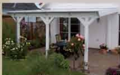
Terrassenüberdachung in weiß 500 x 400 cm