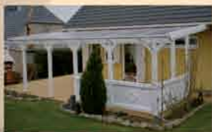
Terrassendach in weiß 870 x 350 cm